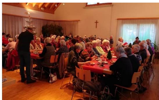
Viele frohe Gesichter