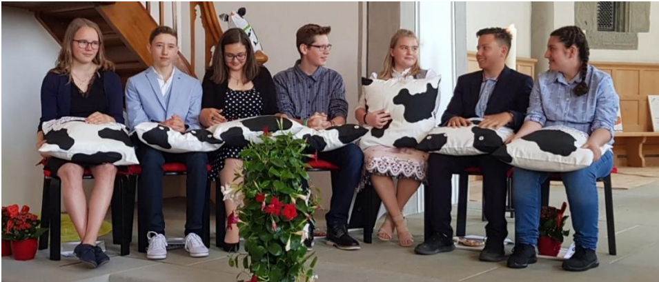
Konfirmation in Sennwald / Bild: Karin Müntener

Die Konfirmation fand in Sennwald am 30. Mai und in Sax am 2. Juni statt.