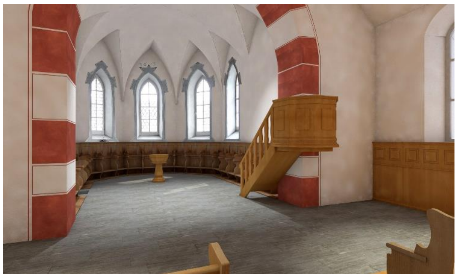
Visualisierung: Blick in den Chorbereich

Die bestehenden Fenster auf der Südseite erhalten eine aussenliegende Isolierverglasung, die neben einer energetischen Optimierung auch schalldämmend wirkt. Die automatisierten Fensterflügel sorgen für eine optimierte Durchlüftung des Kirchenraumes.