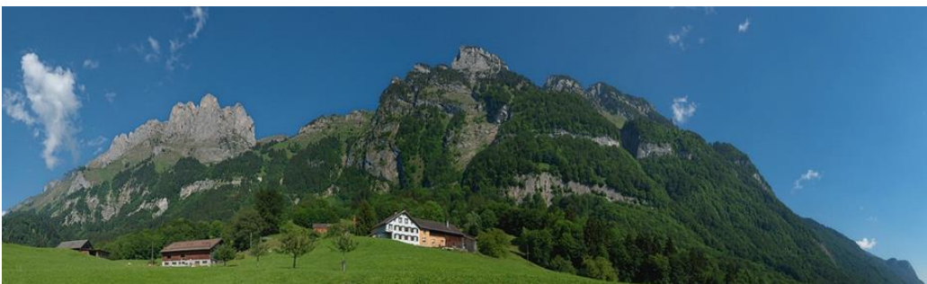
Kreuzberge und Wasen

Eine schöne Tradition ist der ökumenische Gottesdienst auf dem Wasen ob Sax.