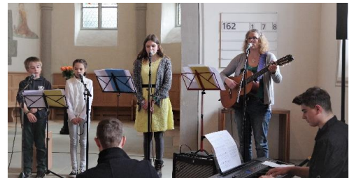
Famigo-Band