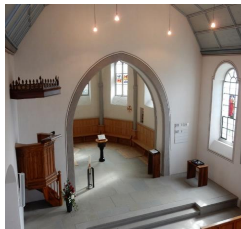
Stimmungsvoll, wenn Kerzen brennen.

Im Gottesdienst vom Bettag letzten Jahres wurde die Kerzenecke zum ersten Mal erleuchtet. Und seitdem haben schon viele Menschen dort im Stillen eine Kerze angezündet.