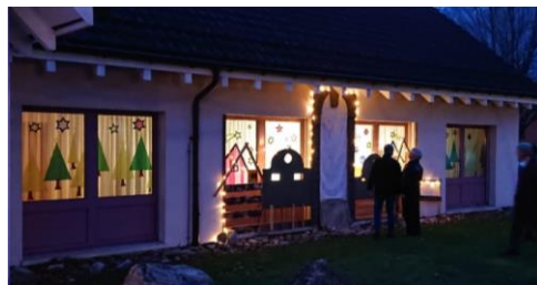
Besinnliche Momente / Bild: Gabriela Heeb-Kaiser

Zum erstenmal gestaltete die Alterskommission zusammen mit den Senioren ein Adventsfenster. Die Senioren bastelten Sterne, Tannenbäume und sogar Häuser aus Holz. Ein schönes Gemeinschaftswerk entstand, welches am 18. Dezember, um 17.00 Uhr, mit dem Plauschchörli Sax feierlich eröffnet wurde. Allen, die zu diesem Gemeinschaftswerk beigetragen haben, ein herzliches Vergelt's Gott.