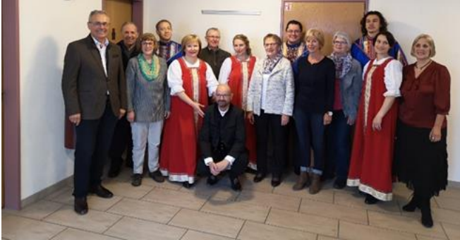
Junggebliebene – auch nach 50 Jahren

In der Feier der Goldenen Konfirmation möchten wir diesen Übergang feiern und um den Segen für das Kommende bitten. » Mit diesen Gedanken lud die Kirchgemeinde alle ehemaligen Konfirmandinnen und Konfirmanden ein. – Bereichert wurde die Feier durch das bekannte russische Lyra-Vokalensemble aus St. Petersburg mit ihren einfühlsamen russisch-orthodoxen Kirchengesängen.