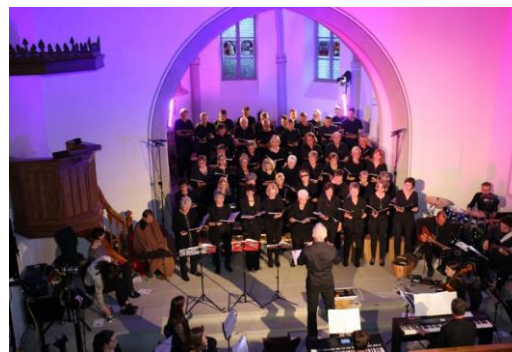
Begeisterung ist spürbar.