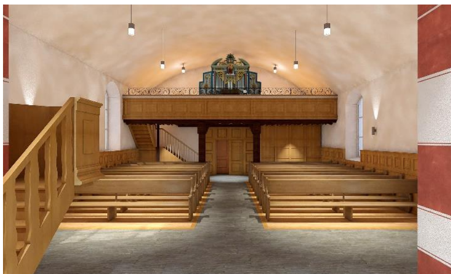
Visualisierung: Blick ins Kirchenschiff / Bild: Cédric Bosshard

Der Emporenaufgang auf der Nordseite wird demontiert und die Öffnung in der Emporenuntersicht verschlossen. Anstelle des Aufgangs wird eine dem Wandtäfer angepasste Schrankfront eingebaut, welcher als Stauraum und Technikzone genutzt werden kann. Die ostseitige Emporentreppe wird komplett erneuert. Auf der Empore wird die Stufenanlage rückgebaut. Die ebene Fläche kann zukünftig flexibel genutzt werden. Hinter der Emporenbrüstung wird ein Gehäuse für den Beamer integriert, der eine optimale Projektion auf die neue Leinwand hinter dem Chorbogen ermöglicht. Für eine optimale Beschallung wird eine neue Akustik+/ Lautsprecheranlage eingebaut. Die zuletzt 1976 sanierte Orgel wird einer umfassenden Revision unterzogen.